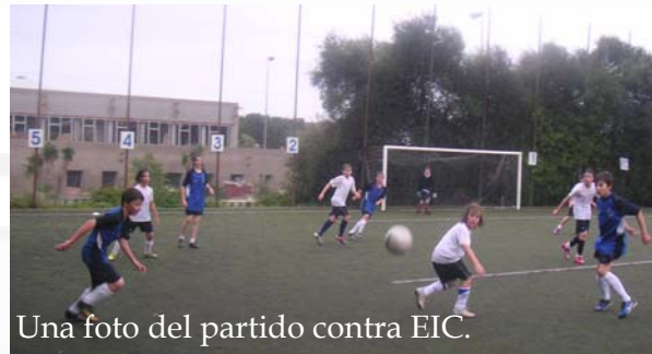
Una foto del partido contra EIC.

Dentro de este número: Fútbol, U13.U15.U19: Baloncesto femenino Día mundial del libro Red nose day El día de Andalucía Viaje al teatro de Málaga Exhibición de arte visual Carrera de "Foundation of friends"